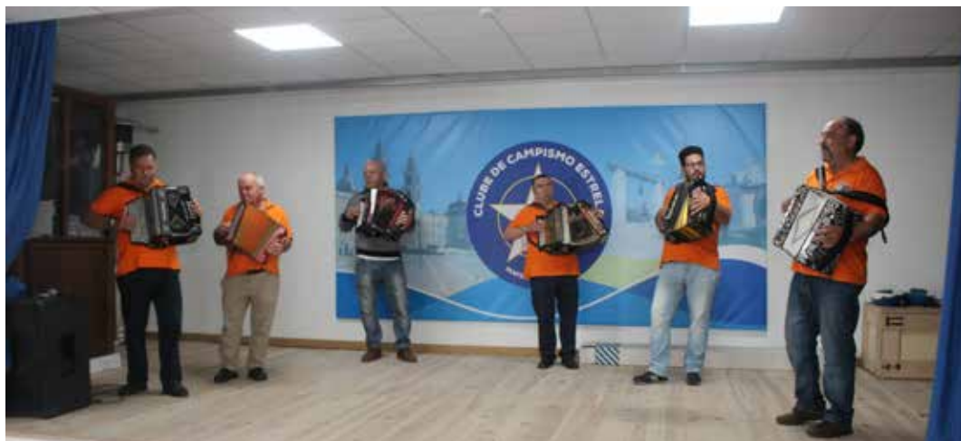
Os artistas no espetáculo de concertinas

No dia que estava destinado à Grande Corrida de Carrinhos de Rolamentos, a Direção agradeceu todos os presentes com duas surpresas: um porco no espeto para compor o almoço do dia e um espetáculo de concertinas para animar ainda mais a tarde. O dito suíno foi temperado a preceito com o já tradicional toque especial do diretor Pedro Raposo, coadjuvado na confeção por outros companheiros já experimentados na secular arte do churrasco. Seguramente que quem teve a oportunidade de provar a iguaria irá recomendar a mesma a qualquer pessoa. Um pouco mais tarde, e para “aquecer” ainda mais a tarde que viria a culminar com a corrida dos carrinhos de rolamentos, fomos brindados com um animado espetáculo de concertinas tocadas por seis artistas notoriamente versados e vocacionados para a arte do toque de tão difícil instrumento. E assim, e sem ninguém esperar, mais uma vez esta Direção demonstrou a sua capacidade de inovar e animar os sócios e utentes, mostrando que vale a pena frequentar o parque, porque nunca se sabe quando poderemos ser surpreendidos com uma qualquer iniciativa espontânea e sempre em favor do são convívio e ânimo dos presentes.