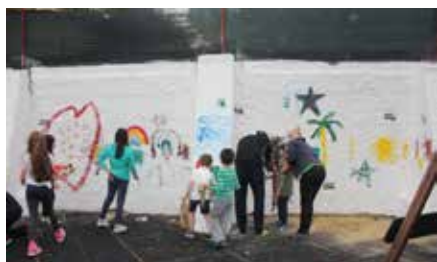
A pintura do muro do Parque Infantil

Como não podia deixar de ser, a tarde do dia 2 de junho foi dedicada às crianças do nosso Clube e aos amigos que os acompanharam numa tarde de diversão.