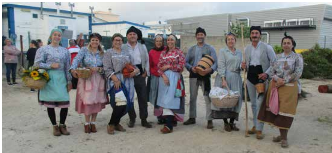
Os saloios do Estrela, vestidos a rigor

Este ano o Santo António no Clube Estrela valeu pelos santos todos!