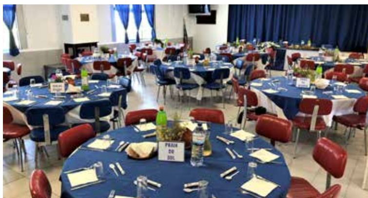
A sala pronta para receber sócios e amigos

O Clube Estrela completou mais um ano de existência e, para comemorar, nada melhor que um almoço onde sócios e amigos se podem reunir à mesa e celebrar esta data. Assim, no dia 19 de maio de 2018, teve lugar, na renovada Sala de Convívio Armando Lopes, o almoço do 76º aniversário do Clube Estrela.