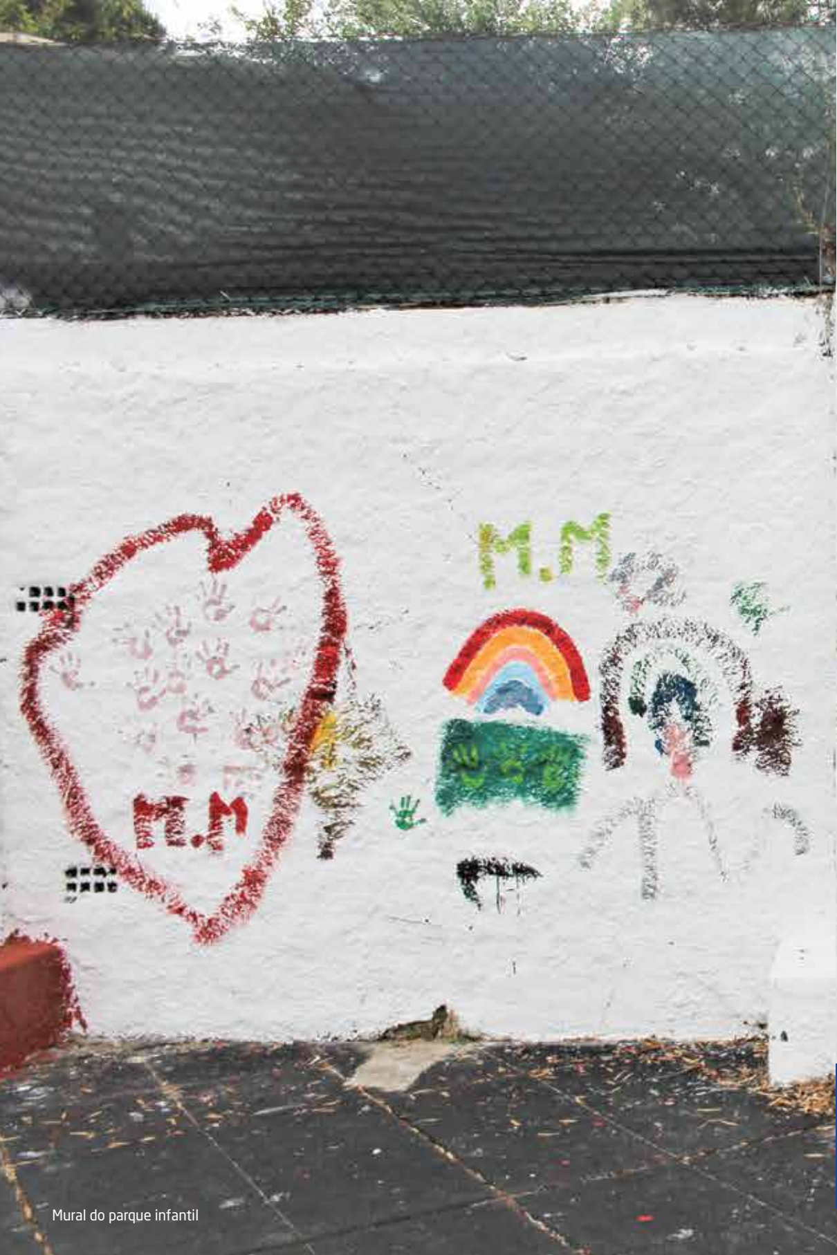
Mural do parque infantil