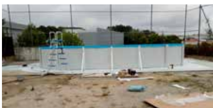
Como tudo começou

Finalmente, ao fim de tantos anos, iniciaram-se os trabalhos para a construção da tão desejada piscinal!