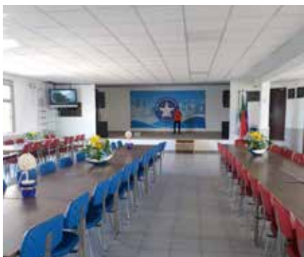
A renovada Sala de Convívio Armando Lopes

Depois de semanas a fio, a reparação do telhado da sala de convívio está concluída. Aproveitámos para realizar mais alguns melhoramentos, nomeadamente no que se refere à substituição do teto falso e da iluminação da sala, às diversas alterações efetuadas no palco (pavimento, iluminação, som e imagem) e também à remodelação total da lareira. Valeu a pena o tempo e o esforço que um pequeno grupo de diretores e companheiros dedicaram à nossa sala de convívio, que ficou certamente mais bonita e mais acolhedora, sempre em prol do companheirismo e da diversão.