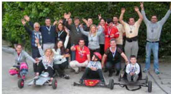
A alegria do grupo de participantes

companheirismo de que só o nosso clube é capaz, os poucos bólides que estavam disponíveis para a corrida foram conduzidos por muitos concorrentes, desde os mais novos até aos mais experientes.