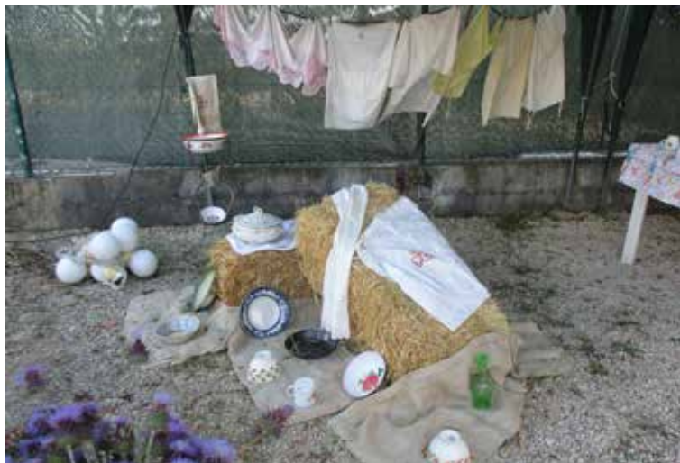
Nada ficou esquecido, nesta terra saloia

Já no início do século XIX se dizia que "Onde acaba Lisboa, começa o reino dos saloios"! E na noite de Santo António do nosso parque de campismo foram eles que reinaram...De repente, havia por todo o lado saias rodadas, lenços e cestos à cabeça, coletes e barretes. Agricultores e lavadeiras, comerciantes e padeiras!