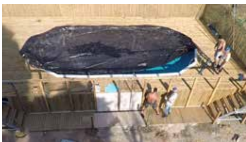
Mãos à obra