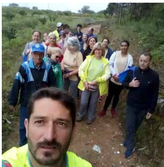
O verde dos campos do Sobreiro

No passado dia 10 de junho o nosso Clube realizou o seu já tradicional passeio pedestre. Com a presença de 22 companheiros, este realizou-se em ambiente bastante animado e salutar, percorrendo diversos caminhos campestres em redor do Sobreiro durante aproximadamente 45 minutos.